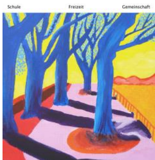
Höhepunkte des Schuljahres 2015/16