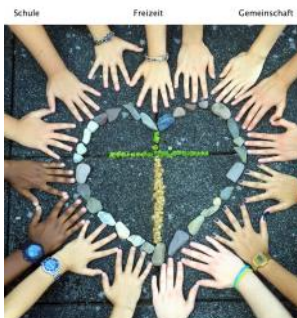
Höhepunkte des Schuljahres 2014/15