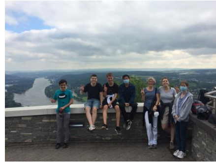
...aber voller Energie oben auf dem Drachenfels!

Herausgekommen ist ein wunderschönes und lustiges Video, das in Windeseile von einem Schüler auf sehr gelungene Weise nachbearbeitet wurde.