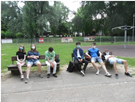
Auf dem Spielplatz noch etwas schlapp...

Als „Antwort“ auf das Video der Deutsch lernenden Oberschüler in Tokyo Anfang des Jahres drehte die Q 1 an zwei Tagen ihr eigenes Video, natürlich immer in deutscher und japanischer Sprache. Nach der Selbstvorstellung (zur „Auflockerung“ auf dem Spielplatz am Rhein gedreht) machte sich der Kurs an einem Montagabend auf, zu Fuß auf den Drachenfels zu steigen.