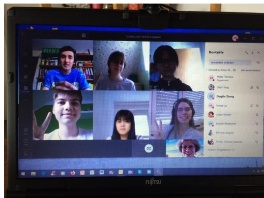
hier die Gruppen A und B der EF!