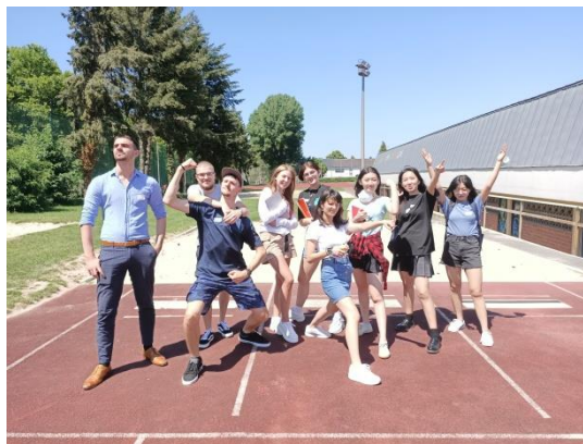
nach dem Abdrehen der letzten Szene auf dem Sportplatz

In der letzten Stunde wurde bei bestem Wetter und in noch besserer Stimmung ein Beitrag für das Video-Austauschprojekt mit einer japanischen Oberschule gedreht, in beiden Sprachen. Thema: das CJD!